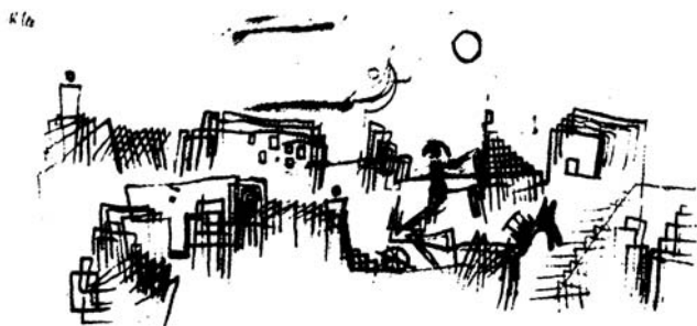
Paul Klee, Duro viaggio attraverso O. , 1927.

ASSOCIAZIONE CENTRO STUDI MONTESORI GENOVA